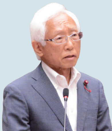
(6月28日 請願に対する討論)