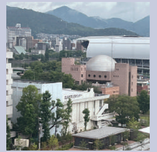
青少年センター（手前）とこども文化科学館

青少年がお金の心配なく活動できるよう応援することこそ市の役割です。現地建替えをと訴えました。