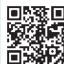
6月25日 大西議員 一般質問